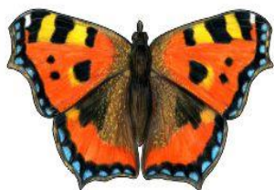
Rusalka pokrzywnik Wielkość: ok. 25cm