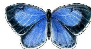
Modraszek wieszczek Wielkość: ok. 27cm

„Wiosenna łąka” – malowanie farbami plakatowymi. Dzieci mają za zadanie namalować farbami wiosenną łąkę. Mogą namalować na niej kwiatki, motyle, ptaszki oraz wszelkie owady i zwierzątka tam żyjące. Powodzenia! Życzę miłej pracy!