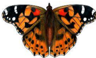
Rusalka osetnik Wielkość: ok. 27cm