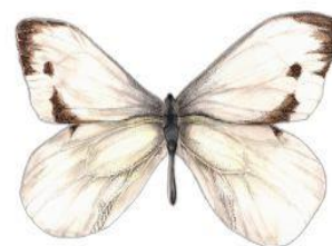
Bielinek kapustnik Wielkość: ok. 25cm