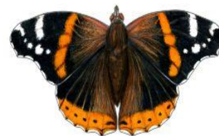
Rusalka admirał Wielkość: ok. 27cm