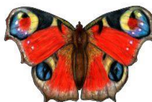
Rusalka pawik Wielkość: ok. 26cm