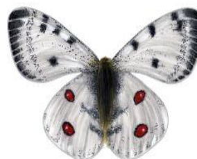
Niepylak apollo Wielkość: ok. 24cm