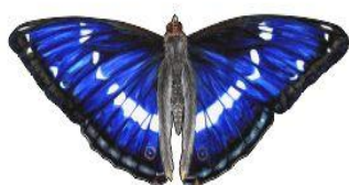
Mieniak tęczowiec Wielkość: ok. 27cm