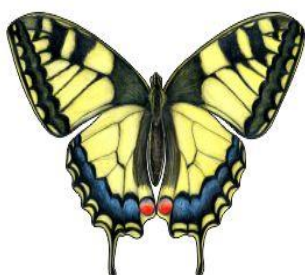
Paź królowej Wielkość: ok. 26cm