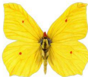
Listkowiec cytrynek Wielkość: ok. 24cm