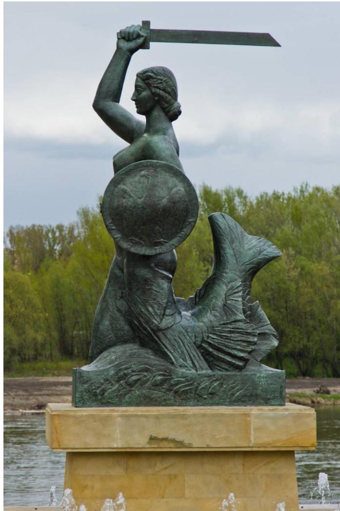
Pomnik Warszawska Syrenka