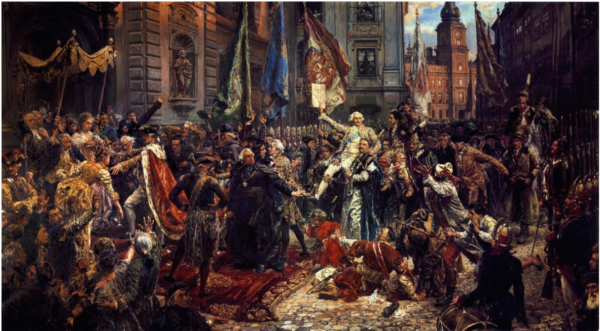
Obraz Jana Matejki pt. „ Konstytucja 3 maja 1791 roku ”